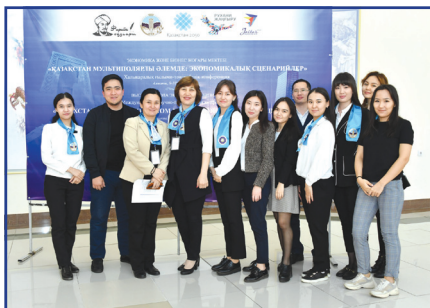
Халықаралық ғылыми конференция