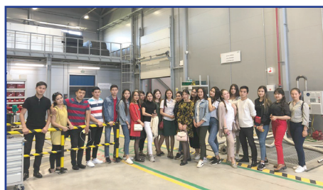
Студенттер «Damu Logistics» компаниясында өндірістік тәжірибеден өтуде