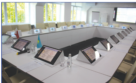
Бизнес-компетенцияларды дамыту кластерінің мәжіліс залы