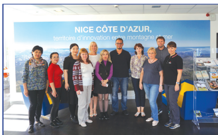
Ниццалық София-Антиполис университетіндегі семинар-тренинг (Франция)