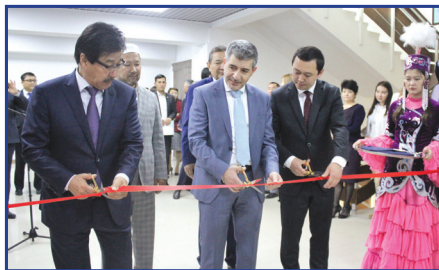
Исламдық қаржы орталығының ашылуы