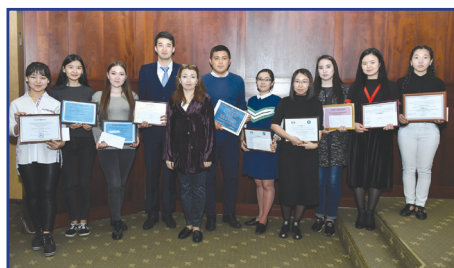
Дарынды студенттерге арналған шәкіртақы