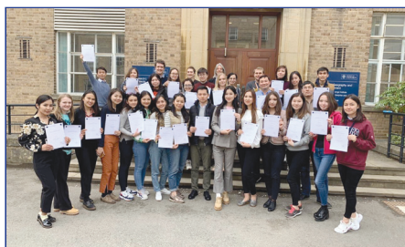
Оксфорд университетіндегі магистранттарға арналған ғылыми тағылымдама (Ұлыбритания)