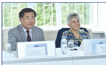
Вашингтон мемлекеттік университетімен әріптестік (АҚШ)