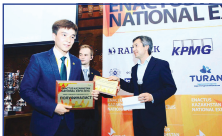
Студенттік кәсіпкерлік — Enactus World Cup (Канада)