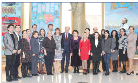
Erasmus + ENINEDU жобасы бойынша координациялық кеңес