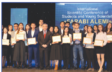
«Фараби әлемі» студенттер мен жас ғалымдардың конференциясы