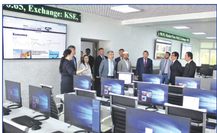
Биржалық технология орталығы