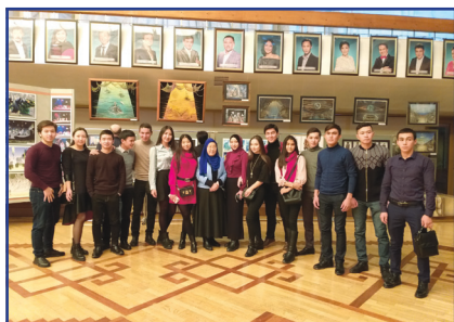
М. Әуезов атындағы театрда

Факультетте Студенттік кеңес, Студенттік маслихат және студенттердің «Сұңқар» кәсіподақ ұйымы сияқты өзін-өзі басқару ұйымдары қызмет етеді.