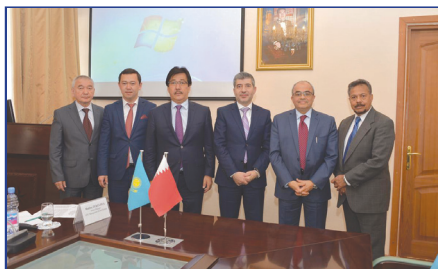
Хамад бин Халифа университетімен ынтымақтастық (Катар)