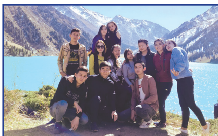
Үлкен Алматы көлінде