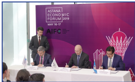
Хамад бин Халифа университеті (Катар), АХҚО мен ҚазҰУ арасындағы үш жақты меморандум