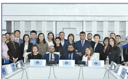
АХҚО, Катар және Бахрейнмен бірлесе өткізілген семинар