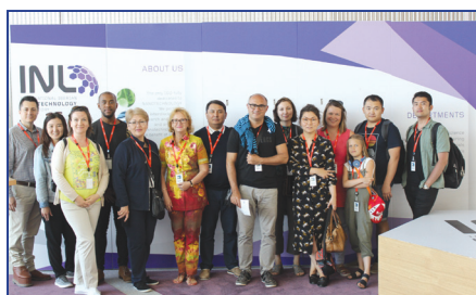
Сантьяго де Компостела университетіндегі семинар (Испания)