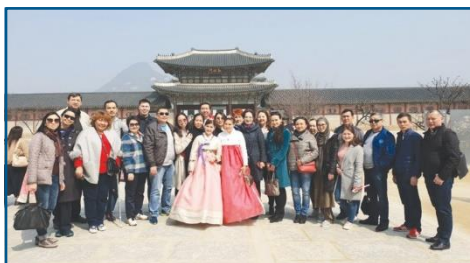
«Medical Park Hospital» Стамбул, Турция, 5 -17 март 2019 г.