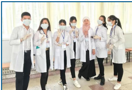
Перерыв между парами...