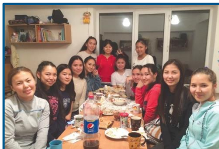
Общение в доме студентов