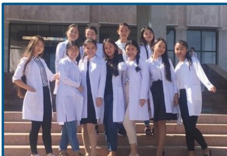
Незабываемая студенческая пора..