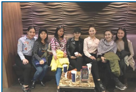
После просмотра фильма «Студент»