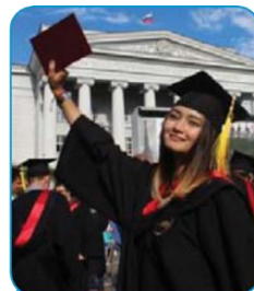
УрФУ имени первого Президента России Б.Н.Ельцина, двуди- пломное образование, магистратура, специ- альность «Психология»