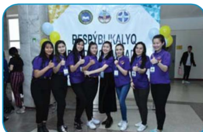
Республиканская предметная олимпиада