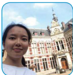
Утрехтский университет (Нидерланды), специальность «Психология», магистратура