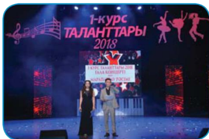
Таланты 1 курса