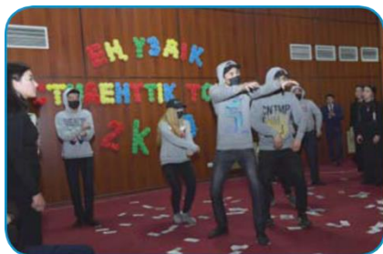
Самая лучшая студенческая группа

Студенческая жизнь на факультете проходит очень интересно. На нашем факультете функционируют 9 организаций студенческого самоуправления. К примеру, профсоюз студентов и магистрантов «Сункар», Студенческий совет, студенческая организация по Болонскому процессу, студенческий маслихат и другие организации.