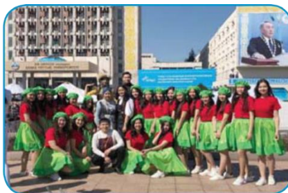
Фестиваль дружбы народов Казахстана