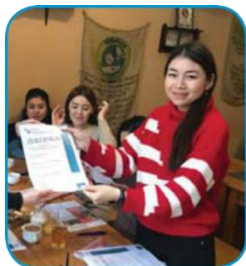
Германия университет Лейпцига

Докторантура специаль- ность «Философия». Турция, Стамбул