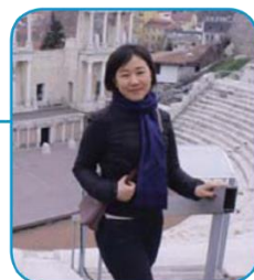
Софийский университет (Болгария), специальность «Культурология», магистратура