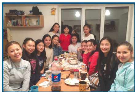
Студенттік үйде рухани кештер.