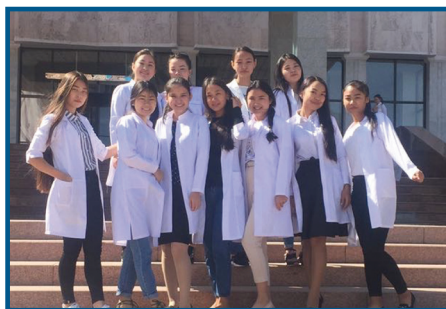
Ұмытылмас студенттік достық кезеңдер.