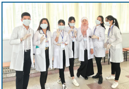
Сабақ арасындағы үзіліс кезінде