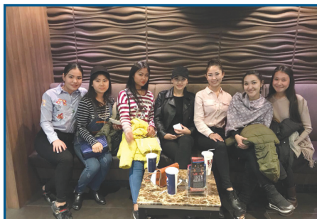
Қыздармен бірге, «Студент» атты фильмнен шыққан сәттегі сурет.