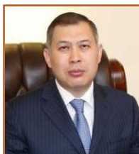
Шахрат Нұрышев Қазақстан Республикасы Сыртқы Істер министрінің бірінші орынбасары