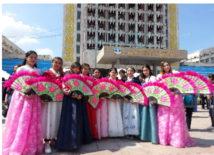
Шығыстың дәстүрлі желпуіш биі

Факультетте Студенттік кеңес, Студенттік маслихат және студенттердің «Сұңқар» кәсіподақ ұйымы сияқты студенттердің өзін-өзі басқару ұйымдары қызмет көрсетеді. Басқа қалалардан келген студенттер жатақханамен қамтамасыз етіледі.