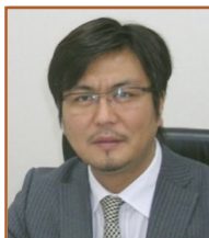
Құрмансейіт Батырхан Қазақстан Республикасының Сыртқы Істер Министрлігінде Ерекше тапсырмалар жөніндегі Елшісі, Шығыстану факультетінің Түлектер қауымдастығының Төрағасы.