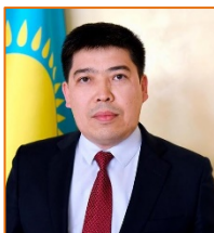
Ерлан Алимбаев Қазақстан Республикасының Сыртқы Істер министрінің орынбасары