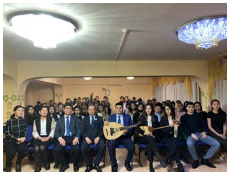
Жатақханада өткен концерт