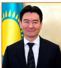
Ғабит Қойшыбаев Қазақстан Республикасының Қытай Халық Республикасындағы Төтенше және Өкілетті елшісі