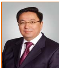
Лама Шариф Қазақстан Республикасының Мысыр Араб Республикасындағы Төтенше және өкілетті елшісі