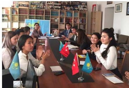
Дәріс барысындағы дебат