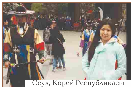
Сеул, Корей Республикасы