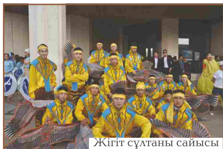
Жігіт сұлтаны сайысы