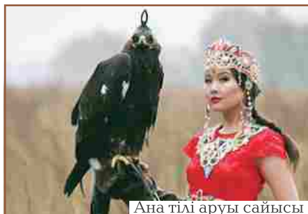
Ана тілі аруы сайысы