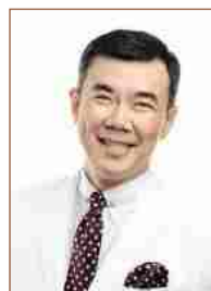
ҚОЯНБАЕВ НҰРЛАН Қазақстандық продюсер, тележүргізуші және актер. 2000 жылғы түлек.