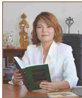
ФАКУЛЬТЕТ ДЕКАНЫ тарих ғылымдарының кандидаты, қауымдастырылған профессор

Құрметті жас түлек! Егер сен табысты мансап жолын құрып, өмірде жетістікке жетем десең ҚазҰУ-дың тарих факультетін таңда!