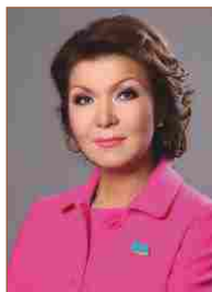
НАЗАРБАЕВА ДАРИҒА ҚР Сенат парламентінің төрағасы. 1985 жылғы түлек.