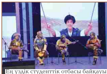
Ең үздік студенттік отбасы байқауы