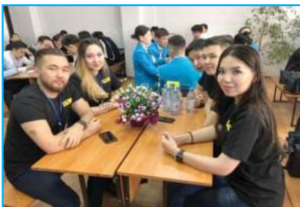
Республиканский конкурс «Криминалист- Эксперт»

Помимо академической подготовки студентов, Факультет ориентируется на развитие полноценного человека в обществе. Доказательством этого являются студенческие организации как «Юридическая клиника», «Студенческий Совет», «Сенат Студентов», «Сұңқар», «Көмек» и традиционные мероприятия социально-воспитательного характера.