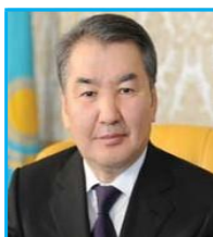
Мами Кайрат Абдразакулы Председатель Конституционного Совета РК