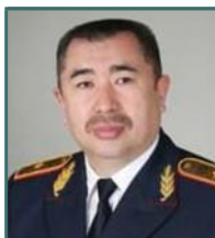
Тургумбаев Ерлан Заманбекұлы Министр Внутренних Дел РК