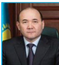
Нурдаулетов Гизат Дауренбекович Генеральный Прокурор РК