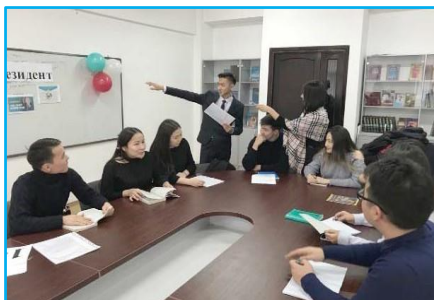
Интеллектуальная игра «Let's brainstorm»