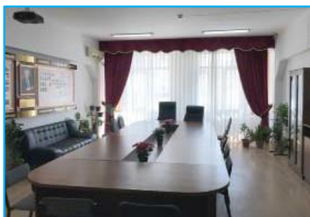
Аудитория имени академика НАН РК Сартаева С.С.