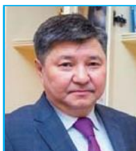
Асанов Жакип Кажманович Председатель Верховного Суда РК