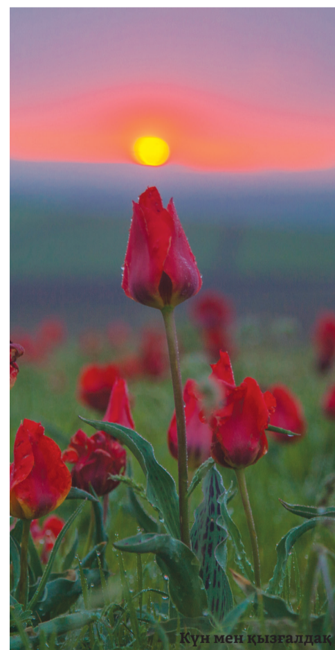
Күн мен қызғалдақ