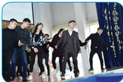
Smart Student Project