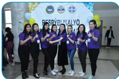
Республикалық пәндік олимпиада