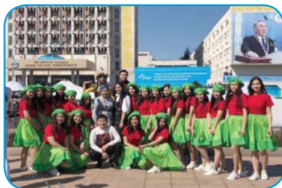
Қазақстан халықтарының достық фестивалі