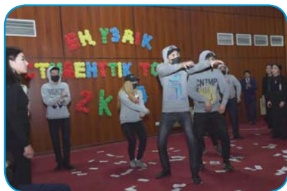
Ең үздік студенттік топ

Факультеттегі студенттік өмір өте қызықты өтеді. Себебі факультетімізде 9 студенттік өзін-өзі басқару ұйымы қызмет етеді. Мысалға, «Сұңқар» студенттер мен магистранттар кәсіподағы, Студенттік кеңес, Студенттік Болон үдерісі бойынша ұйым, Студенттік мәслихат және тағы басқа ұйымдар бар.